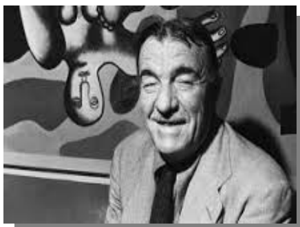
L'artiste peintre Fernand Léger (1881-1955)

Titre du poème : «Liberté, j'écris ton nom»