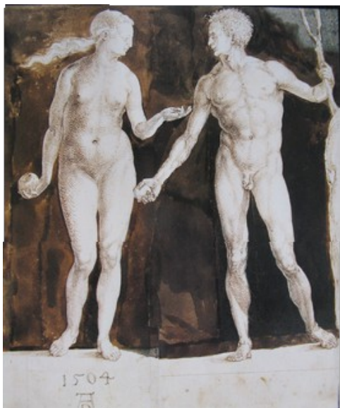
1. Albrecht Dürer Adam et Eve (1504)