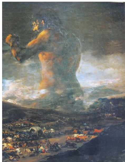
2. Francisco de Goya Le Colosse ou la Panique (1819-1823) Musée du Prado, Madrid