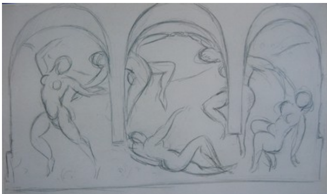
13. Henri Matisse La danse, Première version (1930-1931) Musée Matisse, Nice