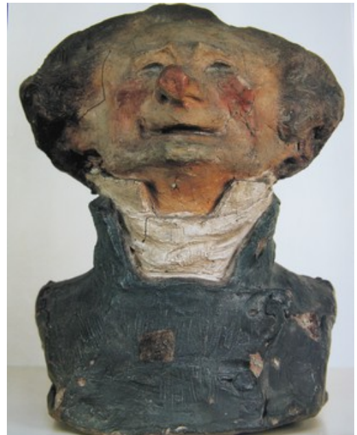
12. Honoré Daumier Charles Philippon ou le Rieur édenté (1831) Musée d'Orsay, Paris