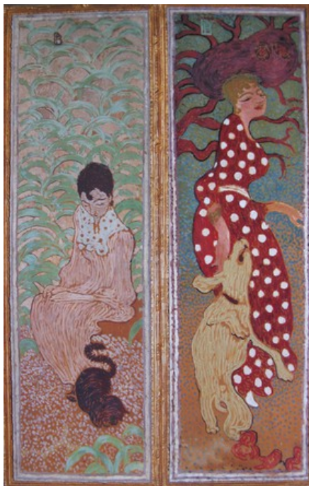
9. Pierre Bonnard Femmes au jardin (1891) Musée d'Orsay, Paris