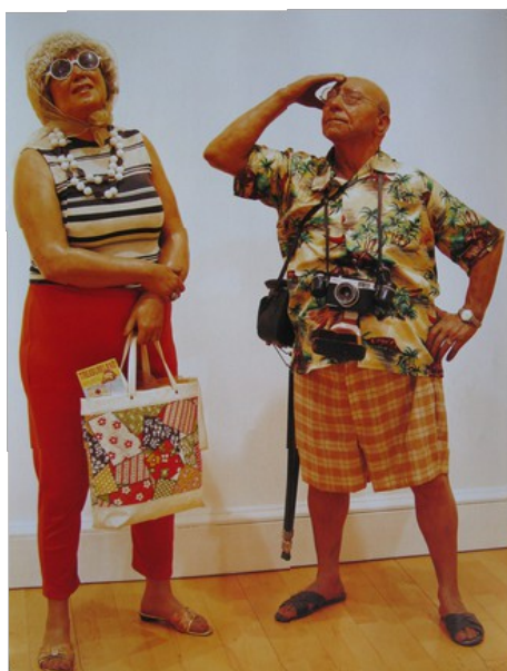
3. Duane Hanson Les Touristes (1970) Scottish National Gallery of Modern Art, Edimbourg