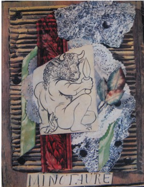
6. Pablo Picasso Couverture pour le Minotaure n°1 (1933) Librairie Oterelo, Paris