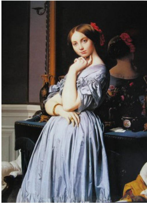
11. Jean-Auguste Dominique Ingres La Comtesse d'Haussonville (1845) The Frick's Collection, New York