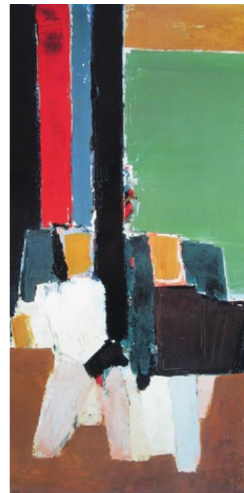
10. Nicolas de Staël Le Lavandou (1952) Musée National d'Art Moderne, Paris