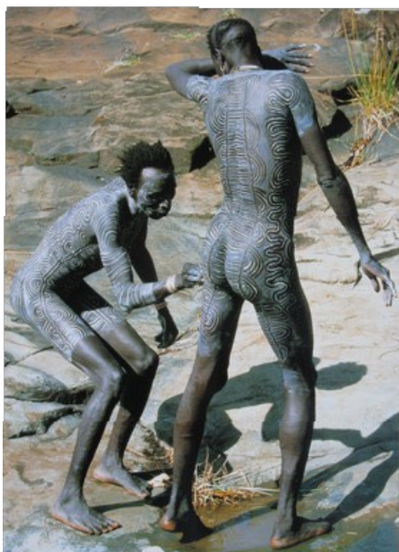
4. Peintures sur le corps (non daté)