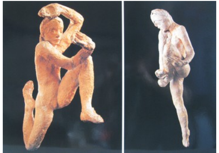
6. Auguste Rodin Mouvement de danse D S.5493 Mouvement de danse I, avec bras droit et pied gauche S.6662 (vers 1910) Terre cuite, musée Rodin, Paris.