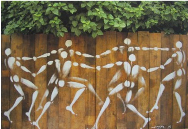
5. Jérôme Mesnager Tableau en palissade photographié par l'artiste rue de la Duée, Paris.