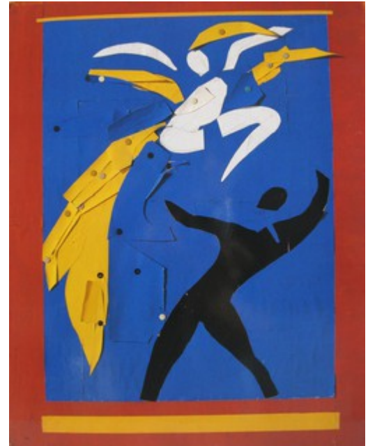
2.Henri Matisse Deux danseurs (1937-1938) étude pour le rideau du ballet rouge,MNAM, Paris