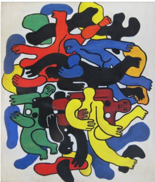
7. Fernand Léger les grands plongeurs noirs (1944) huile sur toile, MNAM, Paris.