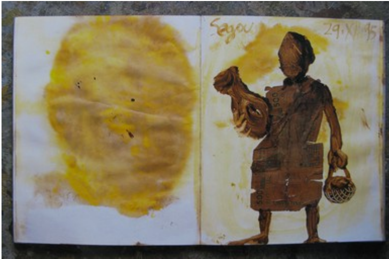
1.Miquel Barcelo Carnet de dessins d'Afrique (1995-1996) dessin à l'encre, pigments naturels, collage sur papier, collection de l'artiste.