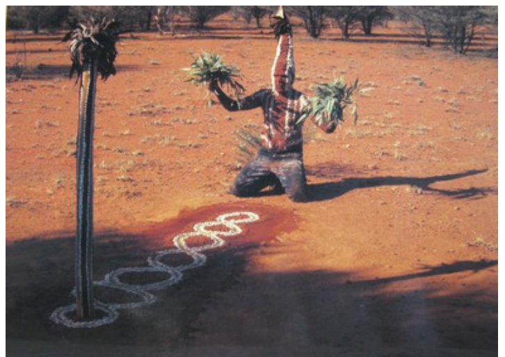
4.Oeuvre collective de six artistes aborigènes Cérémonie Yendumu : Yarla (l'igname) (1988) peinture sur sol