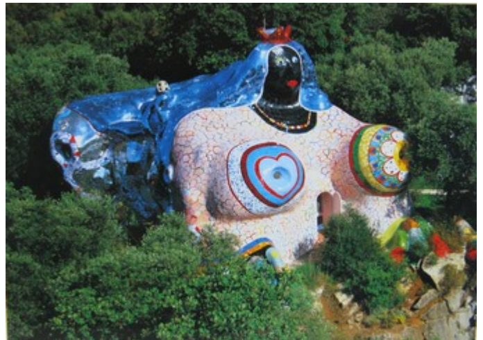
8. Niki de Saint-Phalle l'Impératrice du jardin des Tarots (1979-1993) Garavicchio, Toscane.