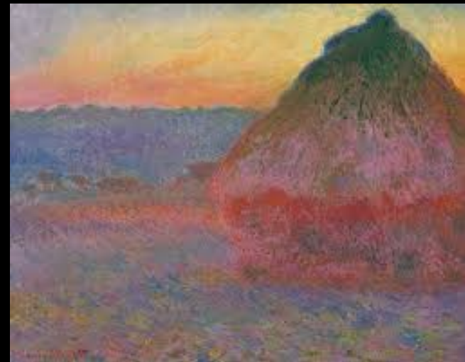
Meule, 1891 Huile sur toile 72,7 x 92,1cm Collection privée