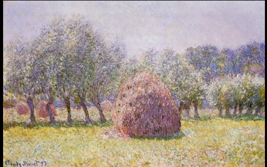
Meules de foin, 1895 Huile sur toile Musée des Beaux-Arts, Springfield, Etats-Unis