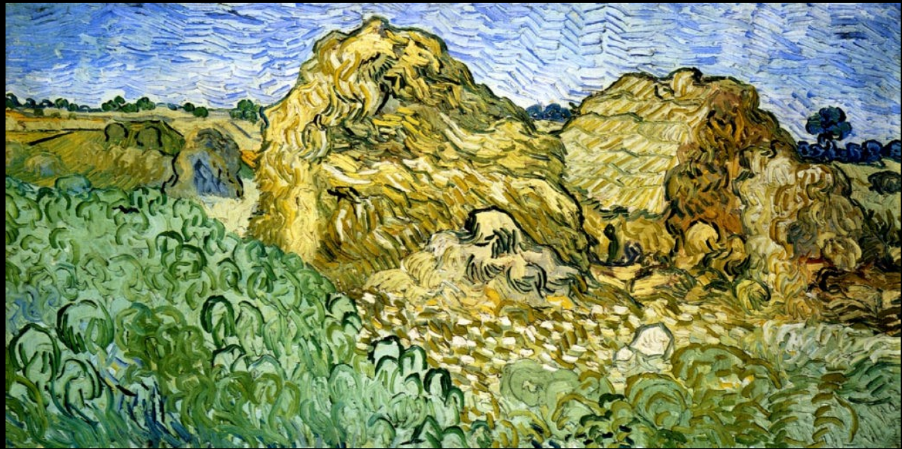
Champ aux meules de blé, 1890 Huile sur toile 50 X 100 cm