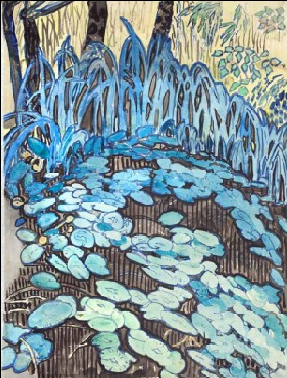
Les nénuphars, vers 1930 (Titre attribué) Encre de Chine et gouache sur papier 62 x 47 cm Collection particulière