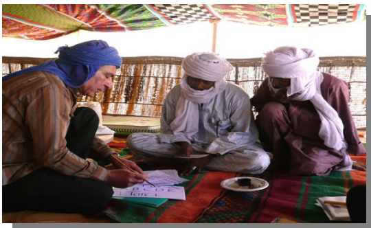
Atelier de calligraphie dans le désert

*Calligraphie : l'art de bien former les caractères d'écriture manuscrite