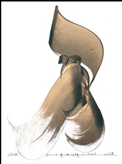
Sur la terre, il y a place pour tous