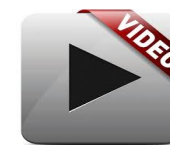
Site et galerie de l'artiste